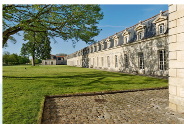
Arsenal de Rochefort

La région Nouvelle-Aquitaine est connue pour ses paysages variés et de qualité. Le caractère exceptionnel des plus remarquables d'entre eux peuvent justifier une protection de niveau national. Le site du "parc de la Garenne et les jardins du Roy de Nérac" a ainsi été classé par décret du 3 juillet 2020, sa conservation présentant un intérêt général du point de vue historique et pittoresque. Par ailleurs, la ministre de la Transition Écologique a attribué en 2020 le label "Grand Site de France" pour leur renommée internationale à la Vallée de la Vézère et à l'estuaire de la Charente/ Arsenal de Rochefort.