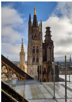
cathédrale Saint André à Bordeaux

L'État a inscrit au plan de relance 80 millions d'euros en faveur des cathédrales. En Nouvelle-Aquitaine, dans la logique d'une mise en œuvre rapide de ces crédits, les travaux sur les cathédrales de Bayonne, Bordeaux, La Rochelle et Limoges ont été retenus dès l'automne 2020 pour un montant de plus de 9 millions d'euros. Ces crédits viendront s'ajouter à la programmation régulière inscrite au budget de la DRAC et qui concernent les 10 cathédrales de la région. Grâce à l'ensemble de ces moyens supplémentaires, qui augmentent de 30% les dotations traditionnellement allouées aux Monuments historiques, les enjeux de sécurité pourront être priorités aux côtés des travaux de restauration.